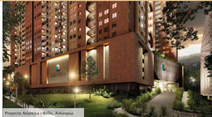
Proyecto Atlantica - Bello, Antioquia