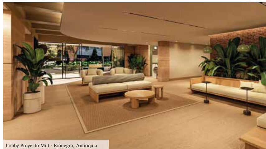
Lobby Proyecto Miit - Rionegro, Antioquia