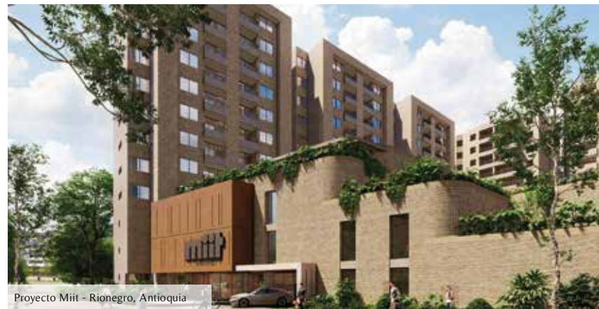
Proyecto Miit - Rionegro, Antioquia