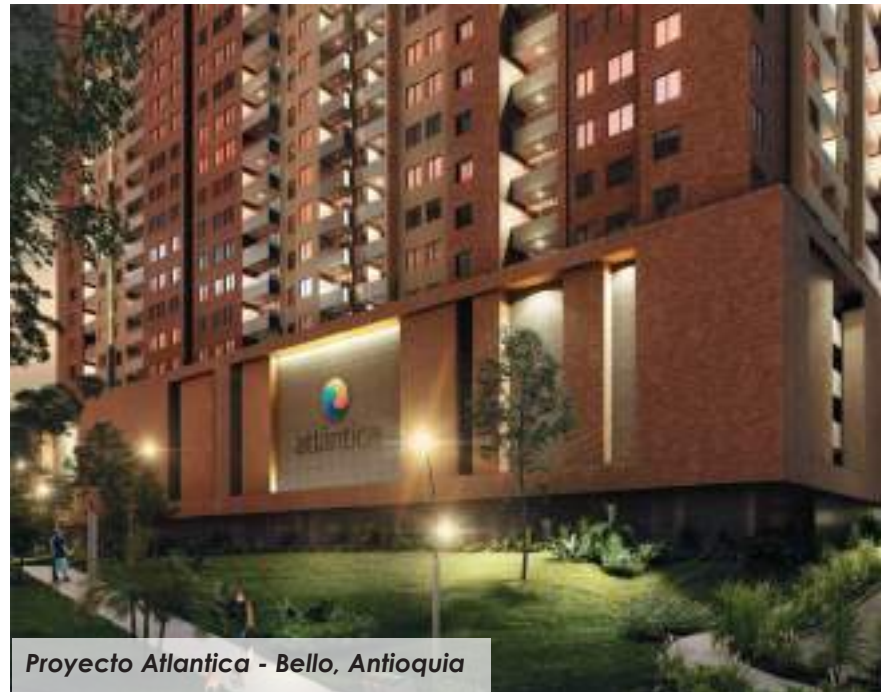
Proyecto Atlantica - Bello, Antioquia

PAIS INVITADO: REPUBLICA DOMINICANA – Proyectos para Inversión desde USD 68.200