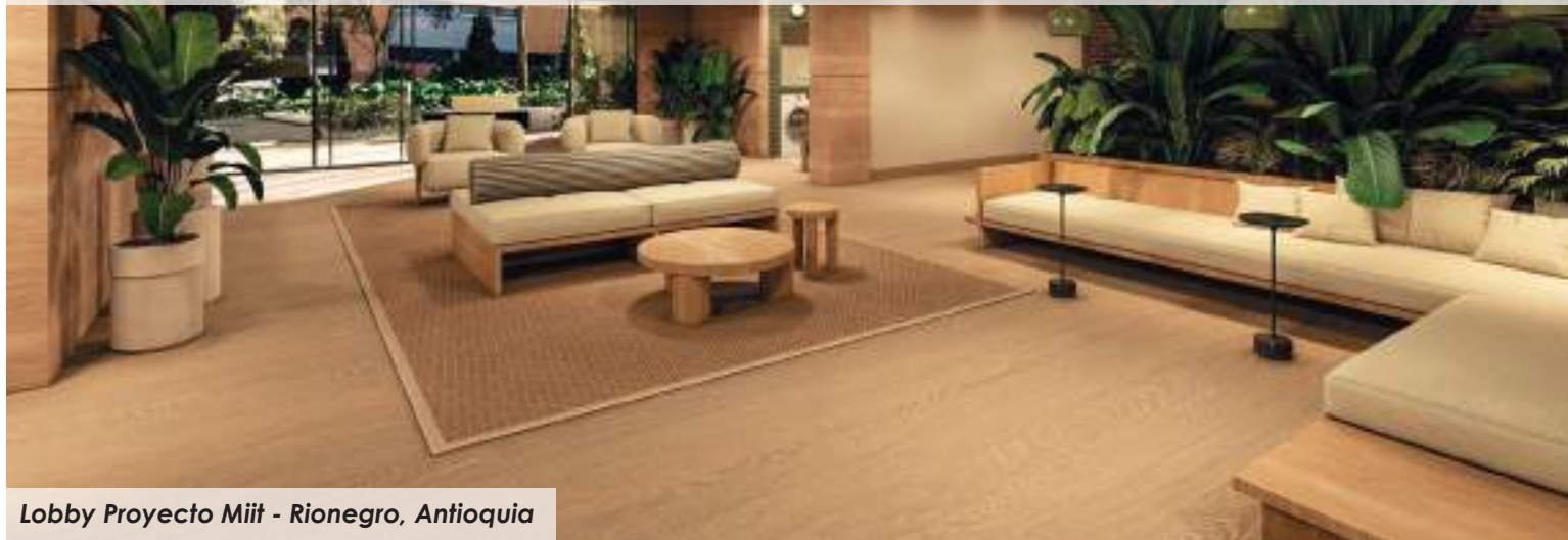
Lobby Proyecto Miit - Rionegro, Antioquia