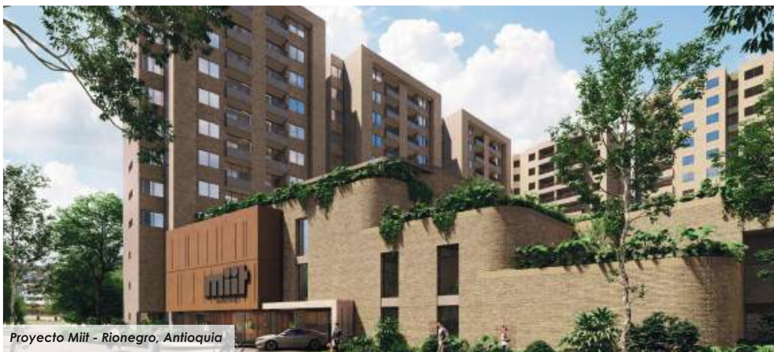
Proyecto Miit - Rionegro, Antioquia

LONDOÑO GÓMEZ: Empresa con 50 años en el sector inmobiliario colombiano. +30 proyectos activos en ciudades como Barranquilla, Bogotá y Medellín. Para ExpoColombia Graz del Río desde COP 588.181.000 - USD 135.300, Atlántica Torre